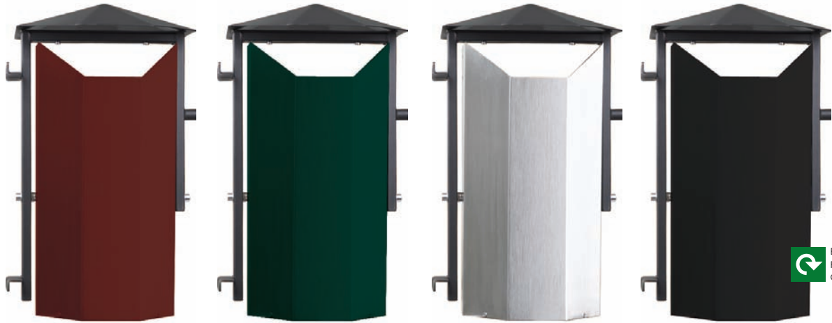
Tippit röd - Ral 3005